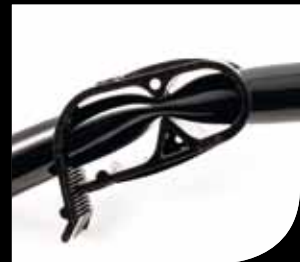
Pinza schiaccia tubo "Squeeze tube clamp"