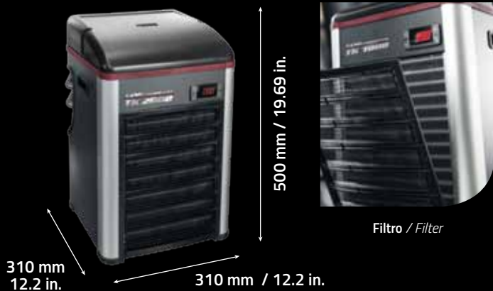
Filtro / Filter