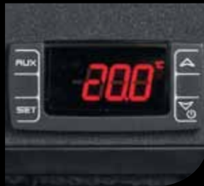
Termostato / Thermostat